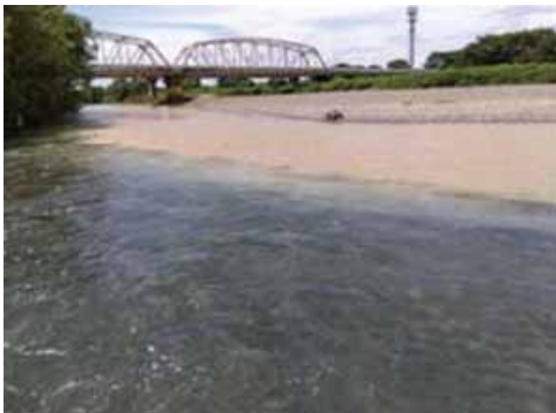
高時川・姉川合流点（手前姉川・奥側高時川）8/31

いずれにしても、今日でも高時川の異常な濁りは深刻です。流域では「井戸が枯渇した」という声も出されています。早急な抜本的対策が必要です